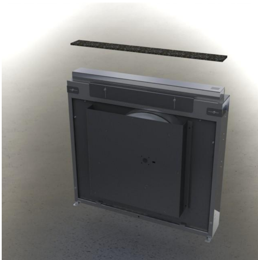
Abbildung 1: Aufkleben der Abdeckung aus Stein

ACHTUNG: Klebestärke auf ein Minimum beschränken!