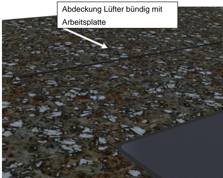
Abbildung 4: Höheneinstellung Lüfter