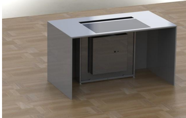
Abbildung 2: Lüfter unter den Ausschnitt positionieren