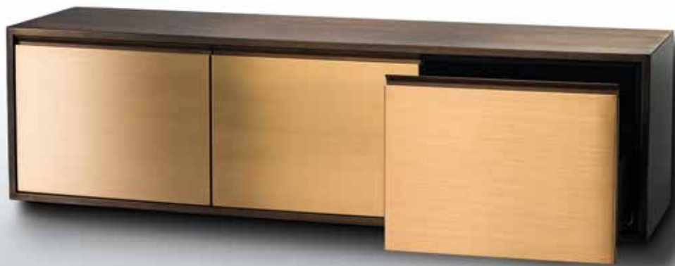
Wenn's mal nicht nur ums Kochen geht – Sideboard als Blickfang.