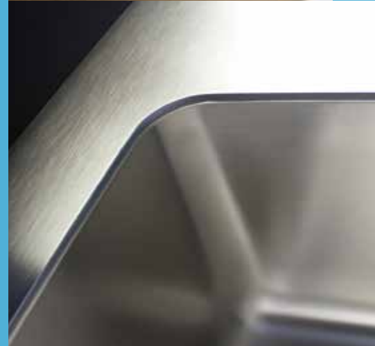
Innovation par le choix des matériaux.

Merial réalise vos rêves de cuisine avec des produits uniques de grande classe et un service impeccable. Les plans de travail et hottes d'aspiration ainsi que le mobilier peu conventionnel en acier inoxydable et autres matériaux hors normes sont produits avec grand soin et précision et offrent une qualité et une manipulation de toute première classe. Merial répond à tous vos souhaits jusque dans le moindre détail et sans compromis, et contribue ainsi à votre cuisine de rêve unique.